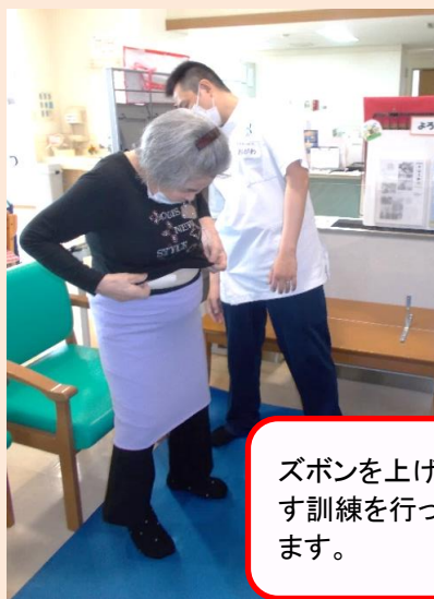
ズボンを上げ下ろす訓練を行っています。