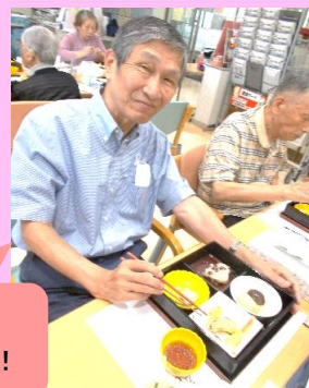
松花堂弁当 とっても美味しいです！