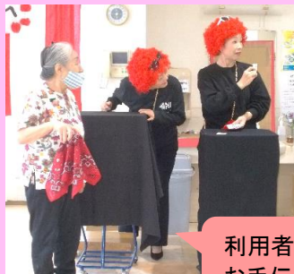
利用者様にマジックショーのお手伝いに参加して頂きました。